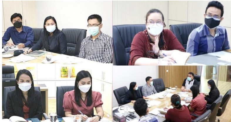
วิทยาลัยการเมืองและการปกครอง