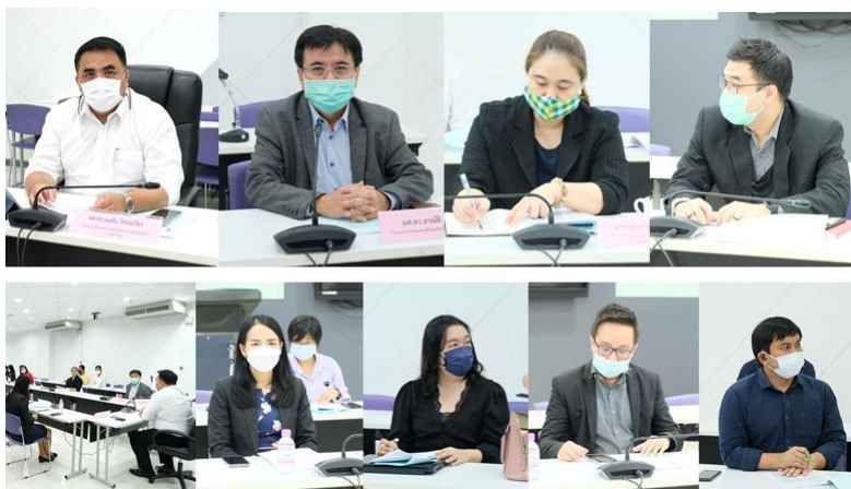
วิทยาลัยการจัดการอุตสาหกรรมบริการ