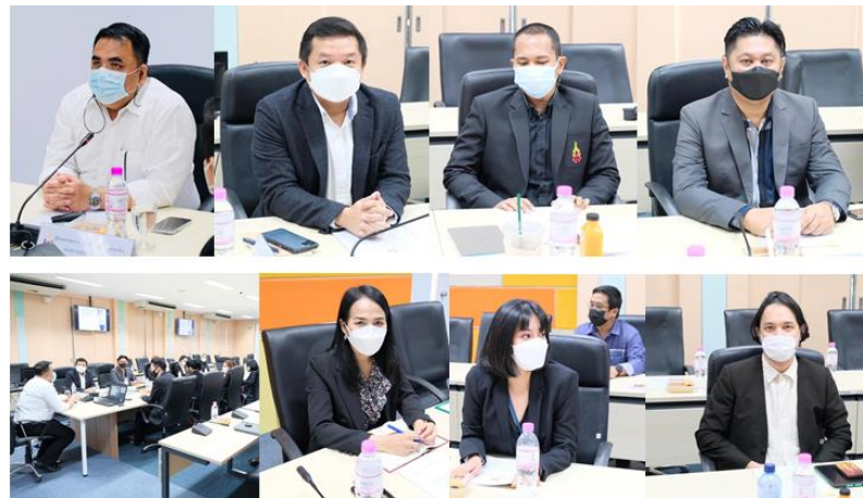
คณะศิลปกรรมศาสตร์