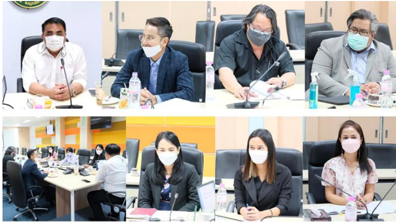
วิทยาลัยนวัตกรรมการจัดการ