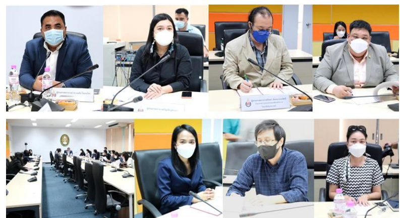
วิทยาลัยนิเทศศาสตร์